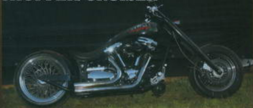
1. místo Petr Hrádek Yamaha Roadstar

Víc informací se nám sem bohužel nevejde, spíš šlo o to, abyste měli přehled a věděli, co se nám v té naší kotlíně (a pár okolních) umlelo. Některým strojům se budeme určitě v budoucnu věnovat. A víte co? Napište nám, o které motorce by vás zajímal článek, zkusíme ji sem dostat.