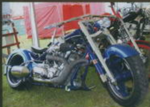
2. místo – Karel Feltl Yamaha Roadstar

Víc informací se nám sem bohužel nevejde, spíš šlo o to, abyste měli přehled a věděli, co se nám v té naší kotlíně (a pár okolních) umlelo. Některým strojům se budeme určitě v budoucnu věnovat. A víte co? Napište nám, o které motorce by vás zajímal článek, zkusíme ji sem dostat.