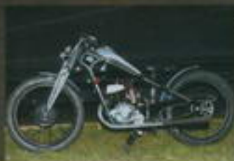
3. místo Tomáš Pittlik CZ 175