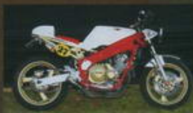
2. místo Jindřich Hanzlík Yamaha FZR400