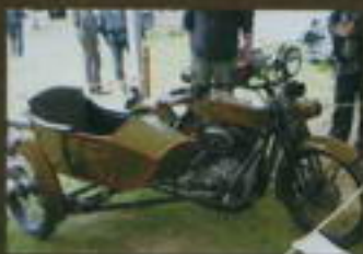
2. místo bratři Zelenkové H-D Sportster