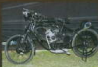
2. místo Petr Tomeš GT Hydrosport