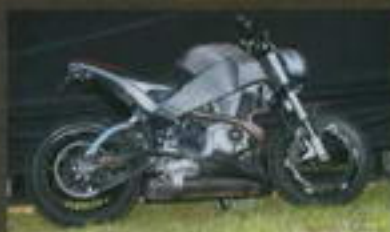
3. místo Václav Vitek Buell XB125