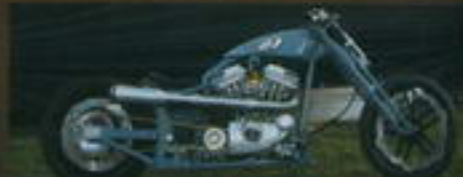
2. místo - Palo Faragula XXL-LM 19 H-D Sportster 1200